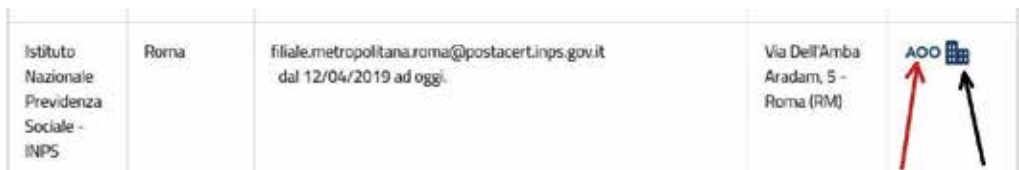
Figura 1: cliccando su AOO (freccia di colore rosso), si accede alla scheda dell'area organizzativa omogenea. Cliccando invece sull'icona che rappresenta un fabbricato (freccia di colore nero) si accede alla scheda dell'Ente ed al relativo indirizzo primario

Va comunque evidenziato che, a seguito di un aggiornamento dell'interfaccia del sito (in data 1.4.2021), dalla consultazione del nuovo IPA risulta non solo univocamente indicato l'indirizzo pec primario della “sezione ente” dell'INPS, ma anche un unico indirizzo pec per ciascuna AOO territoriale (come di seguito illustrato, proprio con riferimento al citato esempio della Direzione Provinciale di Roma).