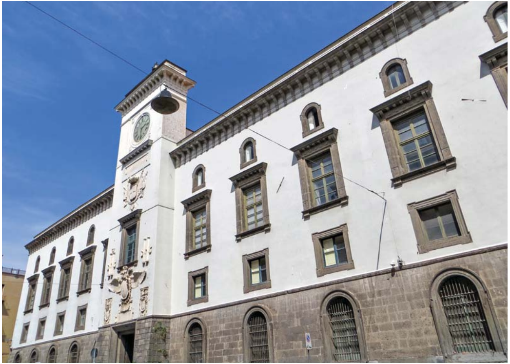
Castel Capuano – Ingresso in via dei Muzii