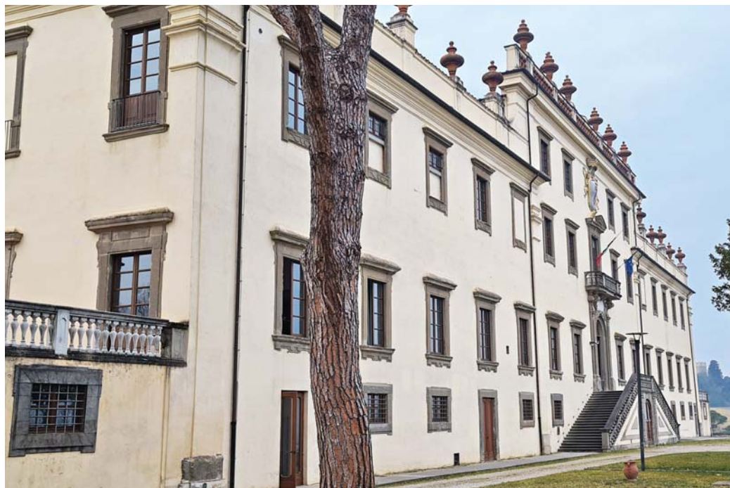
La sede didattica di Villa Castelpulci in Scandicci

Il Ministero, con il particolare interessamento dell'allora Ministra Marta Cartabia, alla quale va la nostra gratitudine, riconoscendo la validità di tale attività e la necessità di stabilizzarla, ha accolto le nostre richieste di ambienti e di personale, consentendo così la realizzazione di questa sede, che oggi, unitamente all'anno formativo del 2023, stiamo inaugurando alla presenza del Presidente della Repubblica.