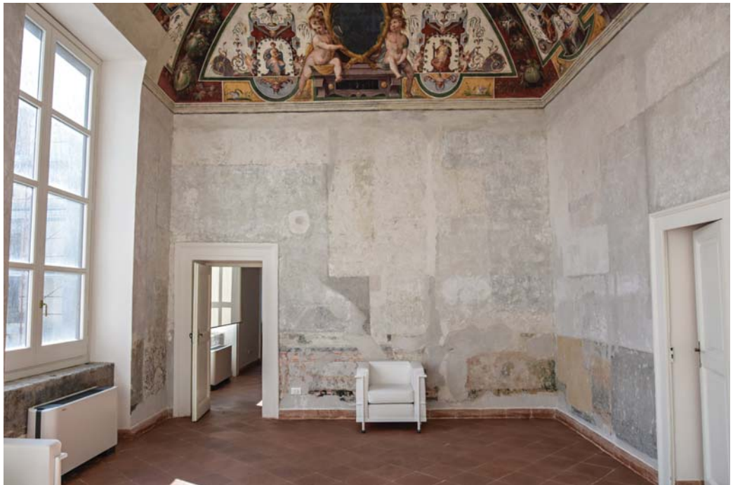
Castel Capuano – Sala affrescata