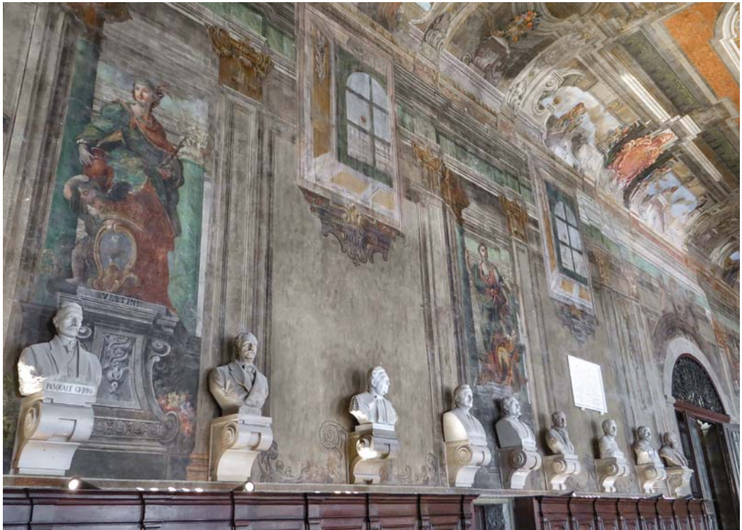
Castel Capuano – Salone dei Busti