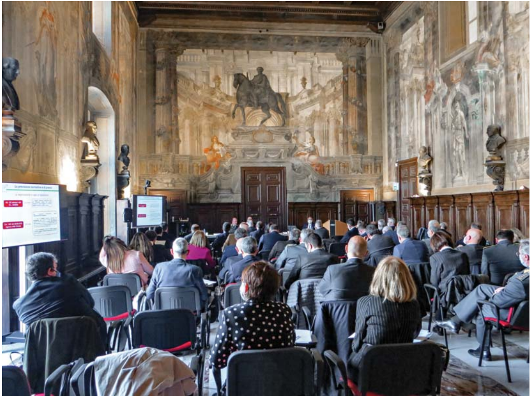
Castel Capuano – Saloncino dei Busti