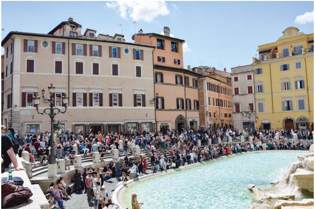
La sede di Roma davanti Fontana di Trevi

rere del tempo e con l'esperienza maturata sviluppa le proprie capacità e riceve i meritati riconoscimenti. Nonostante ciò, la Scuola in questo periodo relativamente limitato è riuscita ad acquisire, insieme con un indiscusso prestigio, un ruolo formativo di primo piano, e questa sede, che ospiterà oltre ai magistrati italiani anche magistrati stranieri, e numerosi già ne ha ospitati, concorrerà a mantenere alto questo prestigio.