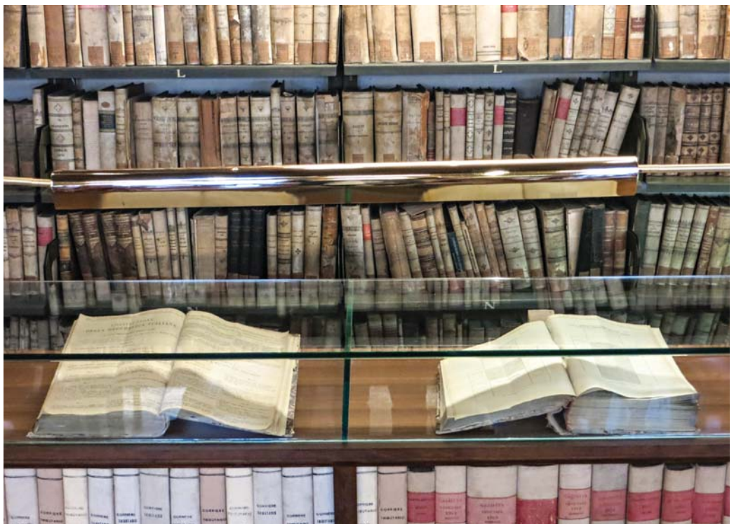
Castel Capuano – Biblioteca Alfredo De Marsico: particolare