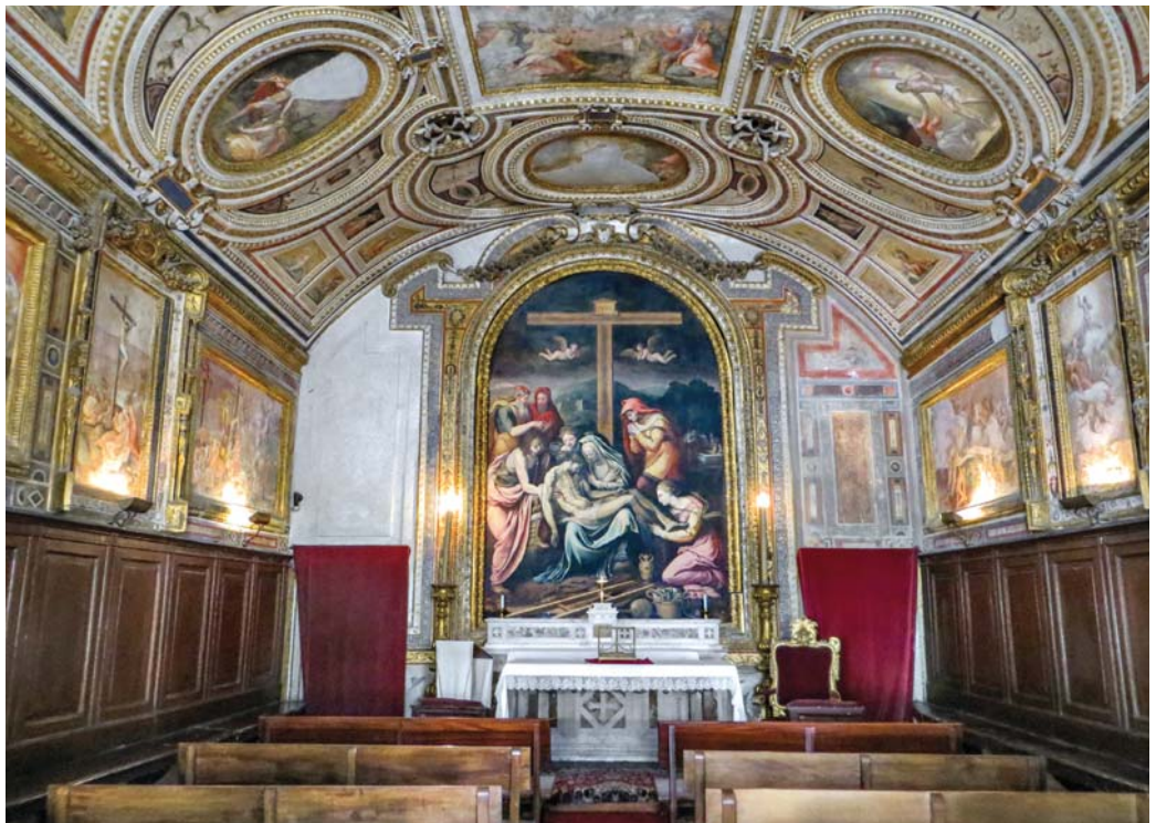
Castel Capuano – Cappella della Sommaria