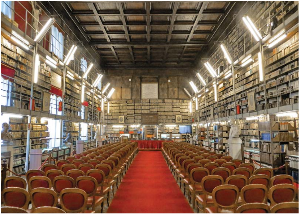
Castel Capuano – Biblioteca Alfredo De Marsico