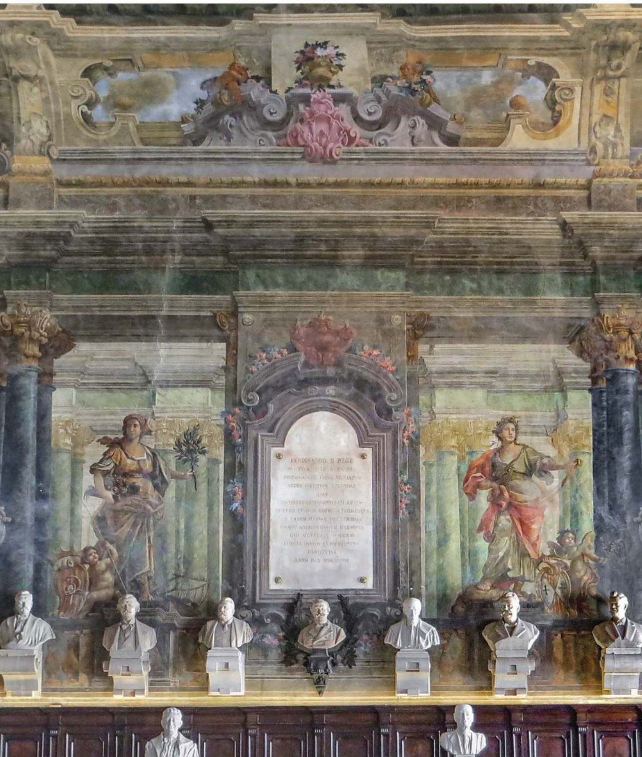
Castel Capuano – Salone dei Busti