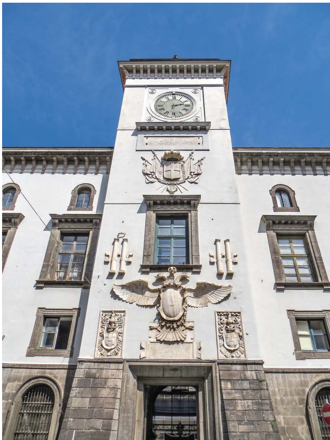
Castel Capuano – Ingresso principale